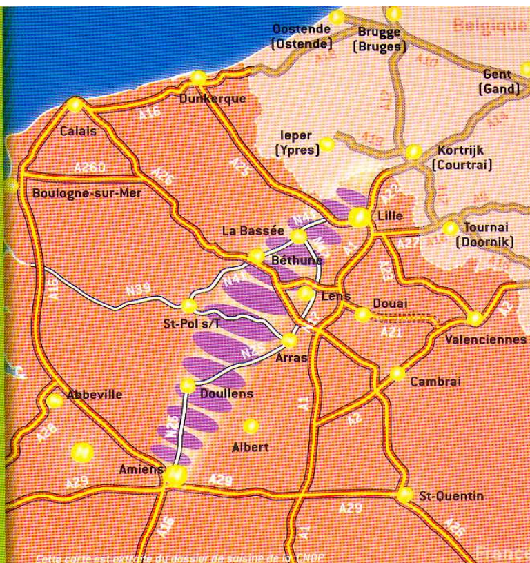
Cette carte est extraite du dossier de soutien de la CNDP.

Le tracé neuf s'affranchit du réseau des RN existant. Celui-ci devient un itinéraire de desserte locale.